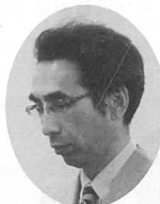
学術奨励賞 三村会員